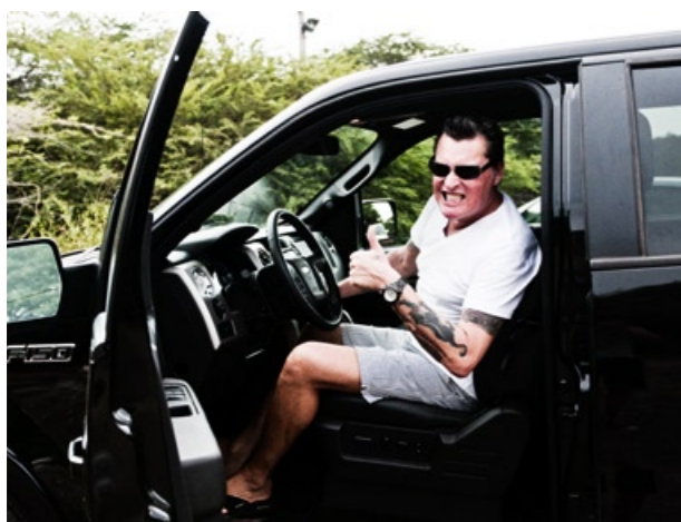
↑ Hier kun je 365 dagen per jaar in je korte broek lopen

moet daar altijd iets kopen. Zij hebben zulke mooie spullen." En dat is niet gelogen. Lot 1038 staat voor fraai designwerk. Het bedrijf bedient het hele Caribische gebied, waar steeds meer Nederlanders een tweede huis kopen. Sandra waant zich als een kind in een speelgoedwinkel. Een doos koffiekopjes rijker stappen we auto in.